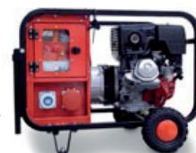
Ejemplo de opcionales: cuadro eléctrico, ruedas y asas.